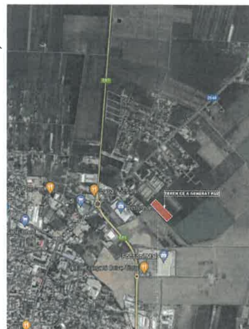
PLAN DE INCADRARE IN ZONA

- primirea observatiilor si solutionarea acestora : 15.03.2023 - 20.04.2023 (35 zile)